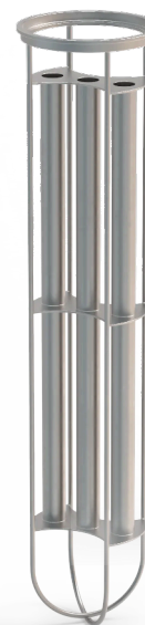
Magnetgestell mit Hüllen